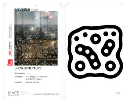
Abb. 1: Vorder- und Rückseite einer Karte

Die Phase des Kartensammelns in der Ausstellung ermöglicht es Besuchern zu einem späteren Zeitpunkt genau jene Exponate zu erkunden, an denen sie interessiert sind. Jede Karte agiert zugleich als Informationsspeicher und –anzeige. Die Karten müssen nicht unbedingt in Verbindung mit interaktiven Tisch verwendet werden: Mit der Sammlung der Karten erhalten die Besucher zudem Erinnerungsstücke, und erstellen persönliche Kollektionen mit Verweisen auf die Exponate.