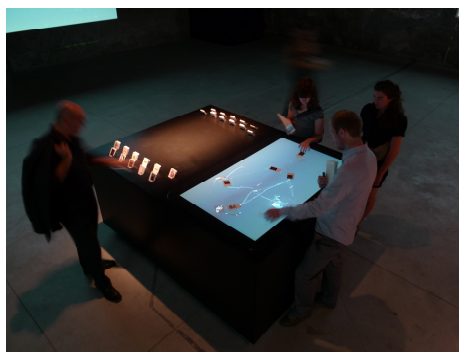
Abb. 4: Besucher auf der Architektur Biennale

Die mæve Installation wurde auf der 11. Architekturbiennale in Venedig ausgestellt. Ein voll funktionsfähiges System wurde implementiert und für Projektdaten des Everyville Studentenwettbewerbs eingesetzt. Wir fragten die Gewinner des Wettbewerbs uns neben Metadaten auch Inspirationsquellen ihrer Arbeit zu nennen, so dass wir Architektur- und Designprojekte aus MACE auswählen und verbinden konnten, um Besuchern die Möglichkeit zu geben, das Verständnis der Idee des originären Beitrags zu vertiefen.