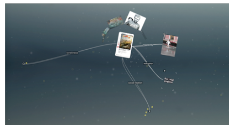
Abb. 3: Vergrößern eines verwandten Projekts

Verwandte Projekte können auch dann erkundet werden, wenn sie nicht durch eine der auf dem Tisch liegenden Pappkarten aufgedeckt wurden. Solche Projekte existieren im Netzwerk, werden anfänglich aber nur angedeutet. Der Nutzer kann sie vergrößern und einige weitere Information zu ihnen erhalten, indem er eine Karte zu diesen hinbewegt (siehe Abb. 3). Die virtuellen Projekte durchlaufen dabei drei Zustände: beginnend mit einem Icon, über eine mittlere Darstellung mit Titel, bis hin zur vollen Größe mit einer Diashow der Medien; und enthüllen somit in jedem Schritt weitere Informationen.